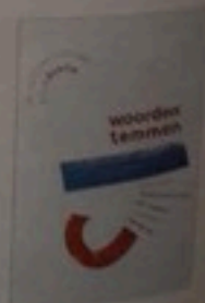
Kila&Babsie Woorden temmen Grange Fontaine € 18,95